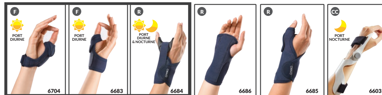
MANUGIB® RHIZACTIVE MANUGIB® RHIZARTHROSE FONCTION MANUGIB® RHIZARTHROSE IMMOBILISATION MANUGIB® TENDINITE MANUGIB® DE QUERVAIN MANUGIB® CANAL CARPIEN