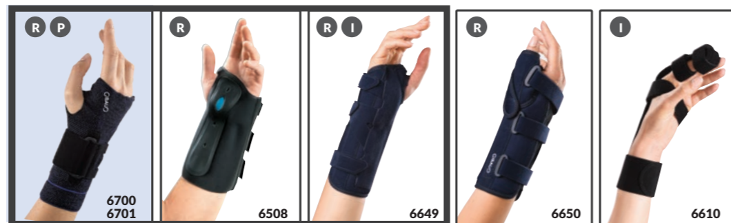
MANUGIB® 3D MANUGIB® TRAUMA POIGNET MANUGIB® TRAUMA POIGNET LONGUE MANUGIB® TRAUMA POIGNET POUCE ATTELLE DOIGT POIGNET